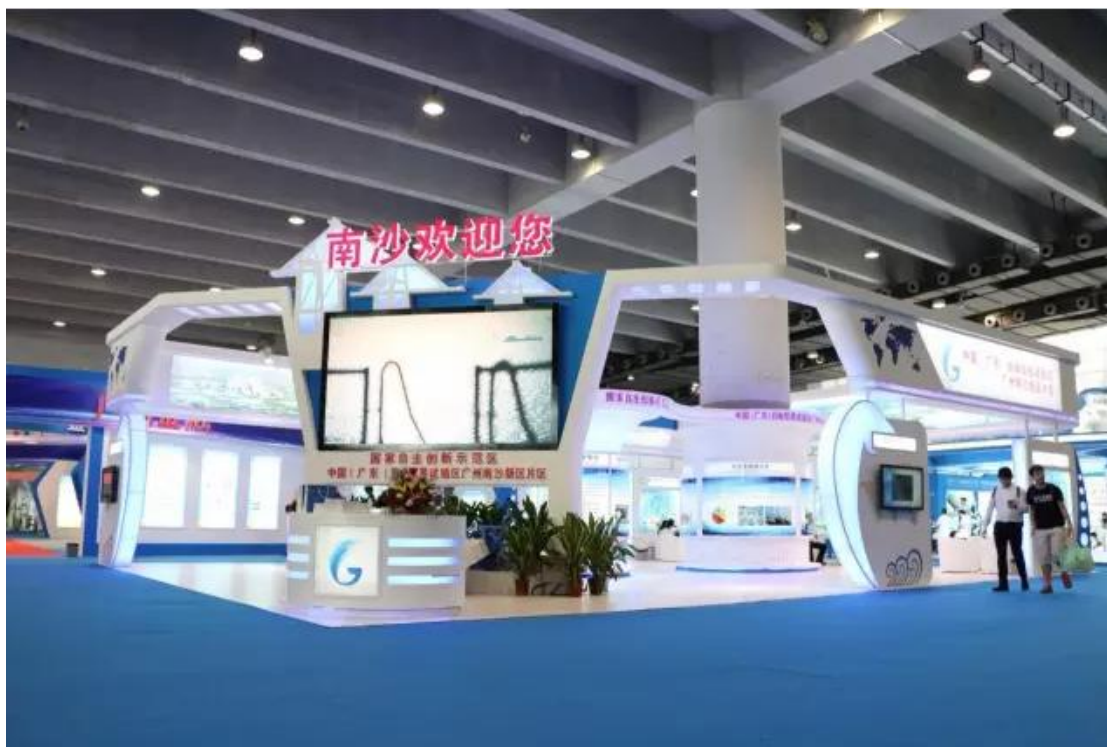
第五届金交会南沙自贸试验区展位

6月24日，第五届中国（广州）国际金融交易·博览会（简称“金交会”）在广州·中国进出口商品交易会展馆B区正式开幕。